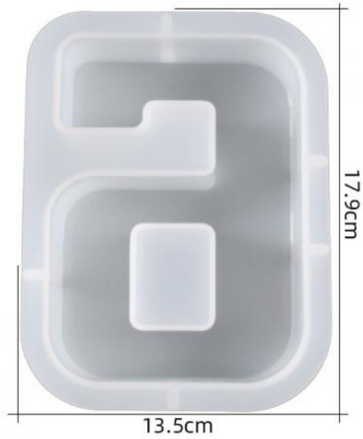
厚度: 4.6cm 成品尺寸:15.5*11.1*4.3cm 超大数字模具-6