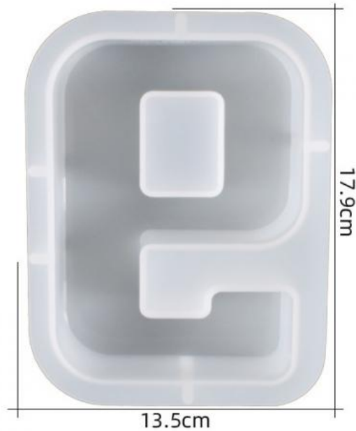
厚度: 4.6cm 成品尺寸: 15.5*11.1*4.3cm 超大数字模具-9