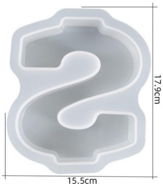
厚度: 4.5cm 成品尺寸:15.5*13.1*4.3cm 超大数字模具-$