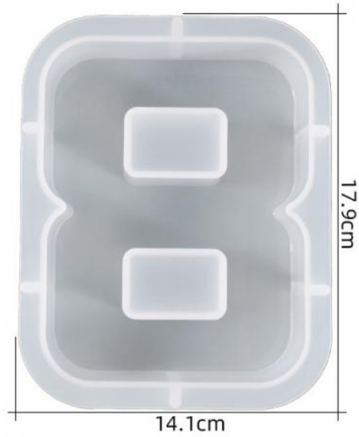
厚度: 4.6cm 成品尺寸: 15.5*12*4.3cm 超大数字模具-8