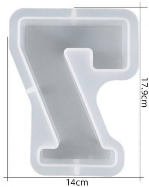
厚度: 4.5cm 成品尺寸:15.5*11.6*4.3cm 超大数字模具-7