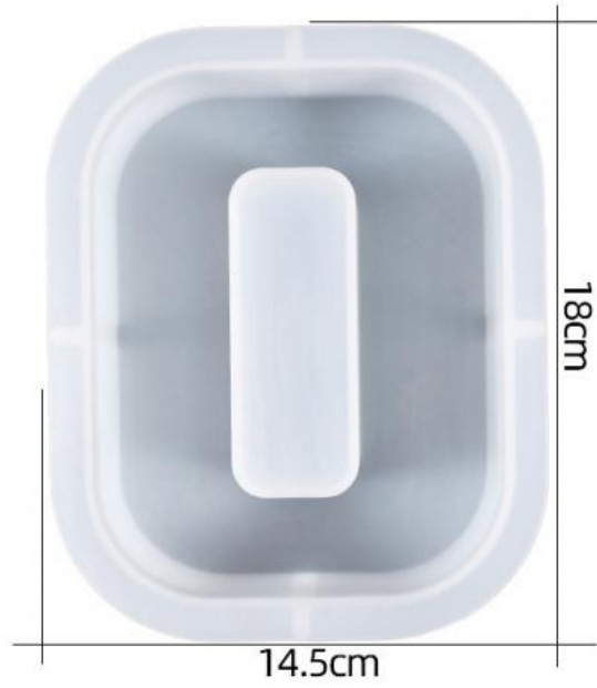
厚度: 4.5cm 成品尺寸: 12*15.5*4.3cm 超大数字模具-0