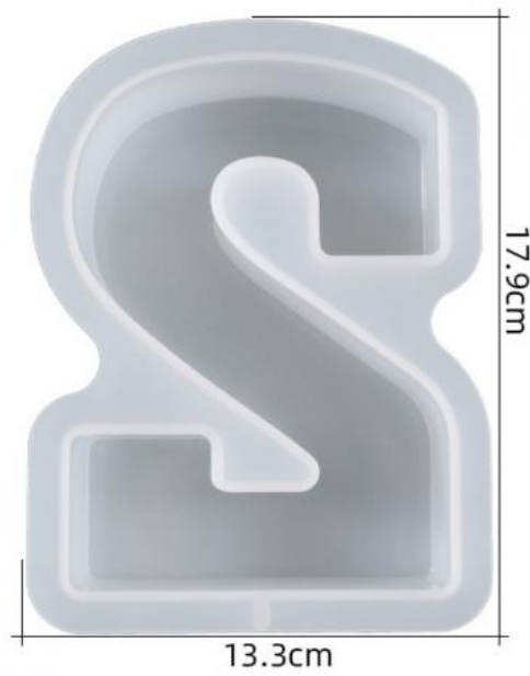
厚度: 4.5cm 成品尺寸:15.5*10.9*4.3cm 超大数字模具-2