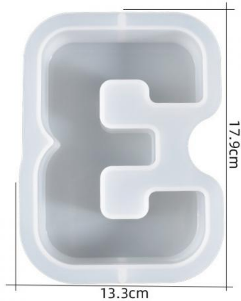
厚度: 4.5cm 成品尺寸:15.5*10.9*4.3cm 超大数字模具-3