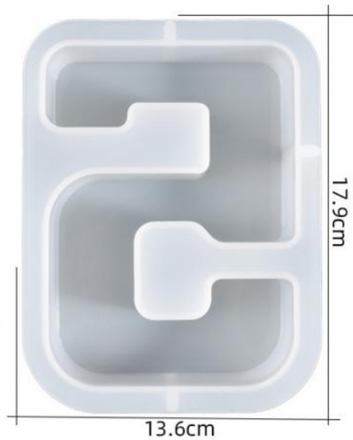
厚度: 4.5cm 成品尺寸:15.5*11.1*4.3cm 超大数字模具-5