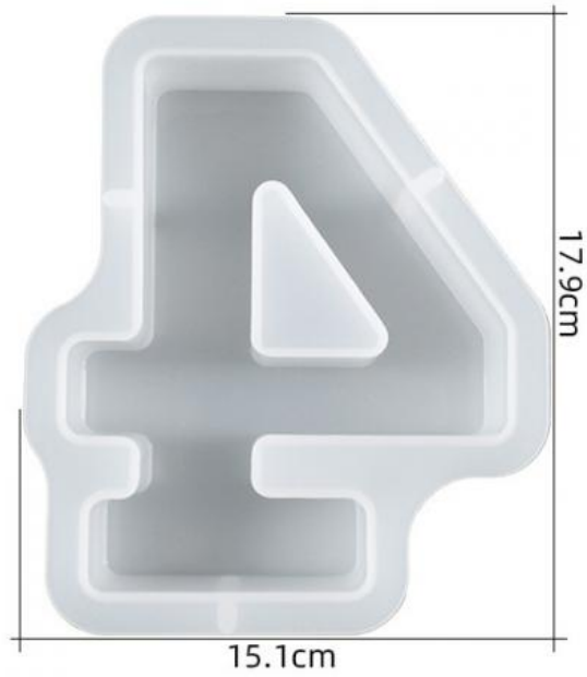
厚度: 4.6cm 成品尺寸:15.5*12.7*4.3cm 超大数字模具-4