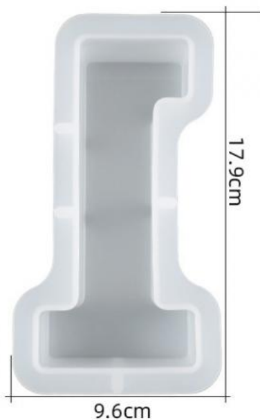
厚度: 4.5cm 成品尺寸:15.5*7.2*4.3cm 超大数字模具-1